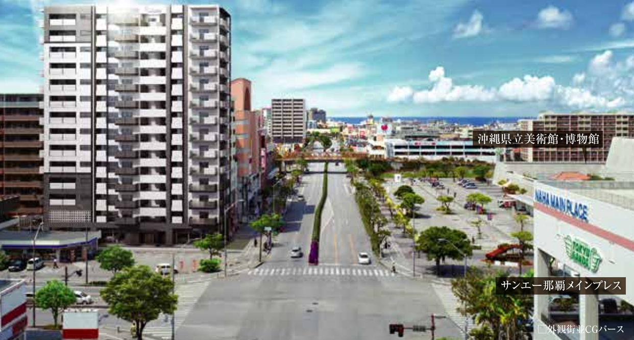
沖縄県立美術館・博物館